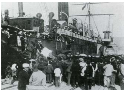
Desembarco del "Leon XIII".

Cada barco que llegaba hacía incrementar en los vigueses la consternación. Especialmente trágica resultó la del "Cheribon", en el que la práctica totalidad del pasaje llegaba moribundo. Pero el desembarco más dramático lo protagonizó el "León XIII" cuando, ante la estupefacción ciudadana, el primero en abandonar el buque fue el General Toral, que se dirigió al Hotel Continental mientras que la soldadesca permanecía a bordo. Un grupo airado de mujeres le increpó, le obligó a volver al muelle y allí, en un ambiente de ánimos muy caldeados, fue quemada una caseta de un comerciante por cobrar precios abusivos por sus viandas.