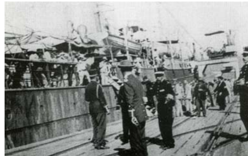
Desembarco del "Cheribon". Archivo Cruz Roja

Un papel absolutamente fundamental jugó el recién creado Comité Local de Cruz Roja en Vigo. Con solamente un año de antigüedad, y creada especialmente en la certeza de que Vigo sería designado Puerto de repatriación de las tropas destinadas en Cuba, organizó hospitales, movilizó a personal voluntario, promovió postulaciones para recabar fondos y se ocupó del desembarco de los soldados, tanto por medio de camillas, como aquellos que, aún sanos, en el momento de echar pie a muelle, se desplomaban por la debilidad.