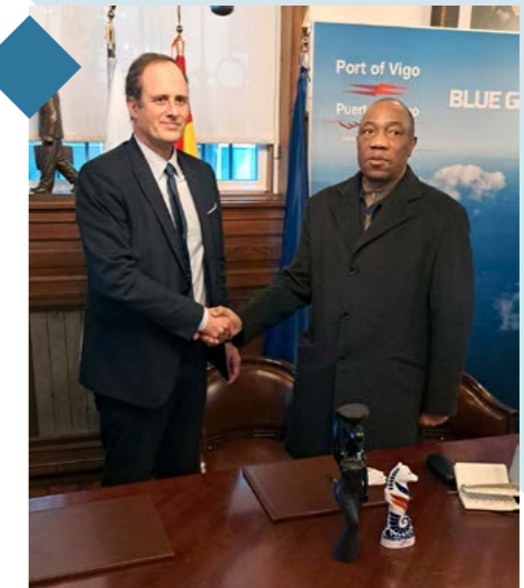
Visit of the ambassador of Mozambique.