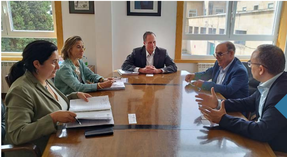
Visita del director general de Tánger Med.

Visit of the general director of Tangier Med.