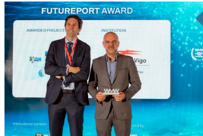
El proyecto "Living Ports", ganador en la 1ª edición de los Premios de la Semana Marítima Mundial dentro de la categoría Puerto del Futuro.