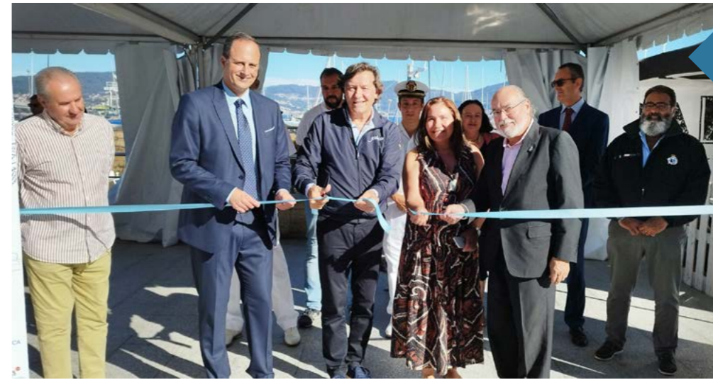
Inauguración de la IV edición de la Semana Azul del Clúster Náutico Ría de Vigo.

Visit of the general director of Tangier Med.