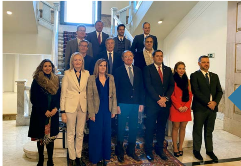
Presentación de la estrategia Blue Growth Vigo en el Senado.

Presentation of the Blue Growth Vigo strategy in the Spanish Senate.