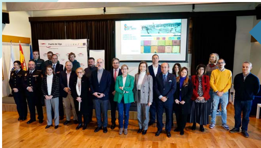
Presentación oficial del Comité de Bienestar del Puerto de Vigo.