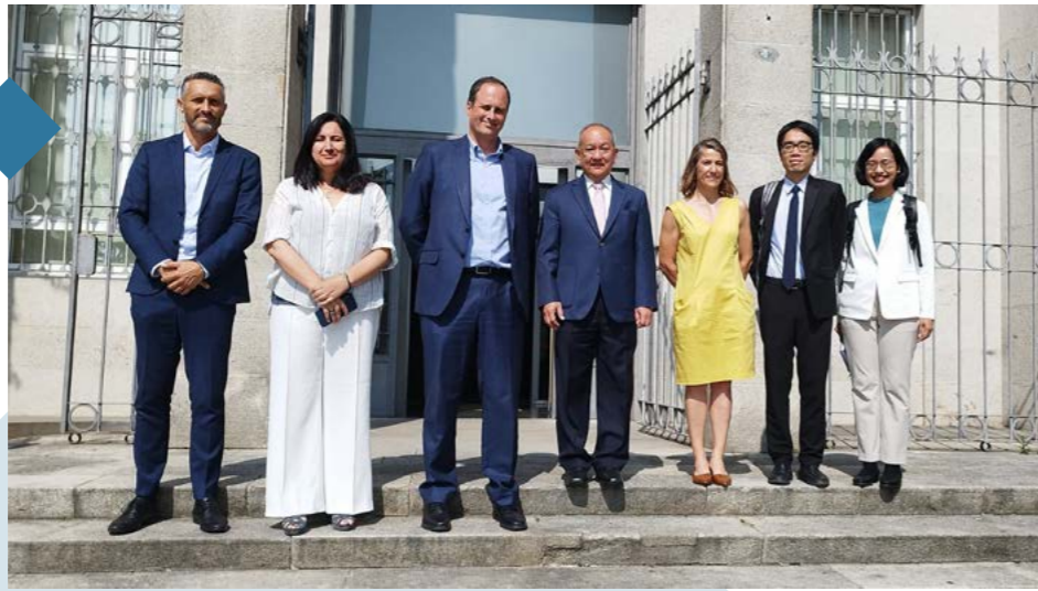
El Puerto de Vigo acoge un taller de expertos de diferentes regiones atlánticas para abordar los desafíos que plantea la transición energética.

Visit of the Thai ambassador to the Port Authority of Vigo.