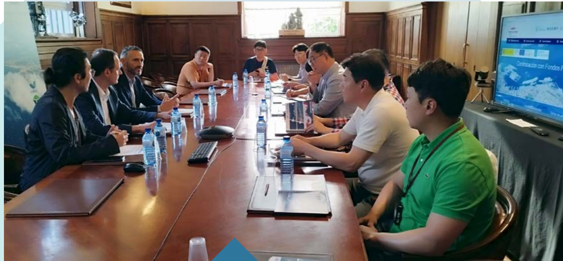
Visita al Puerto de Vigo de una delegación del Gobierno de Corea.

Visit to the Port of Vigo by a delegation from the Government of Korea.