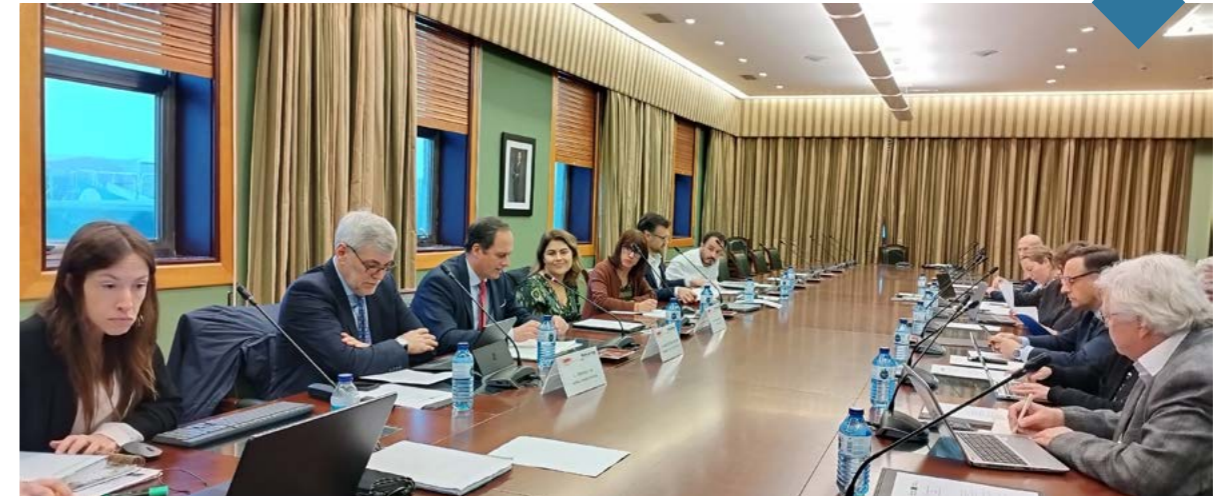
The Port of Vigo will serve as a testing platform for the application of technological solutions that incorporate methanol and hydrogen in ships and as fuel in vehicles within the framework of the "Hydea" project.