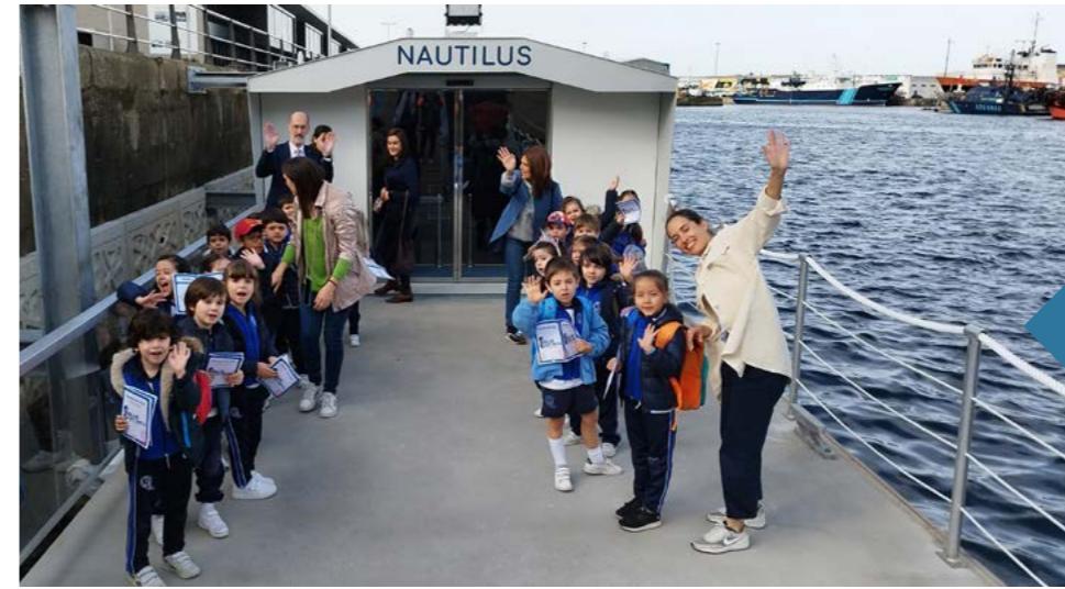
Visitas de grupos de escolares al visor submarino "Nautilus".

Presentation of the Blue Growth Vigo strategy in the Spanish Senate.