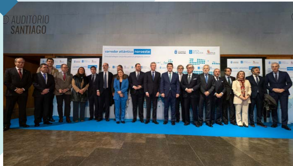
Meeting of the Northwest Atlantic Corridor, led by the presidents of the Xunta, Alfonso Rueda, of the Government of Castilla y León, Alfonso Fernández Mañueco, and of the Principality of Asturias, Adrián Barbón.