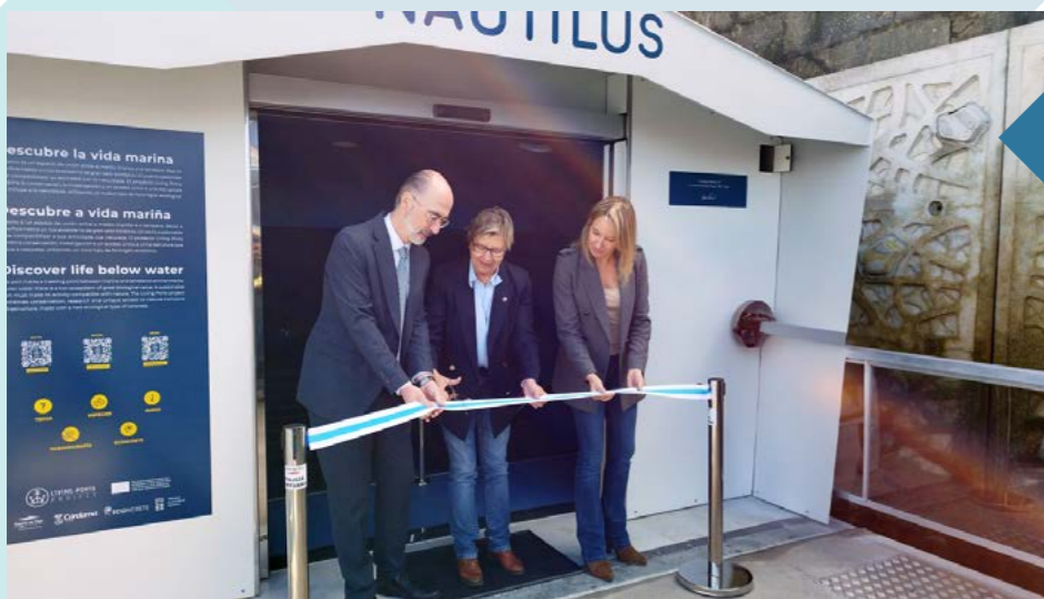
El visor submarino "Nautilus" abre sus puertas a la ciudad.

Visits of schoolchildren groups to the "Nautilus" underwater viewer.