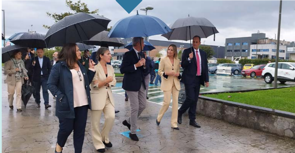
Start of the 2nd phase of the works on the Orillamar cycle-pedestrian path (shipyard area)