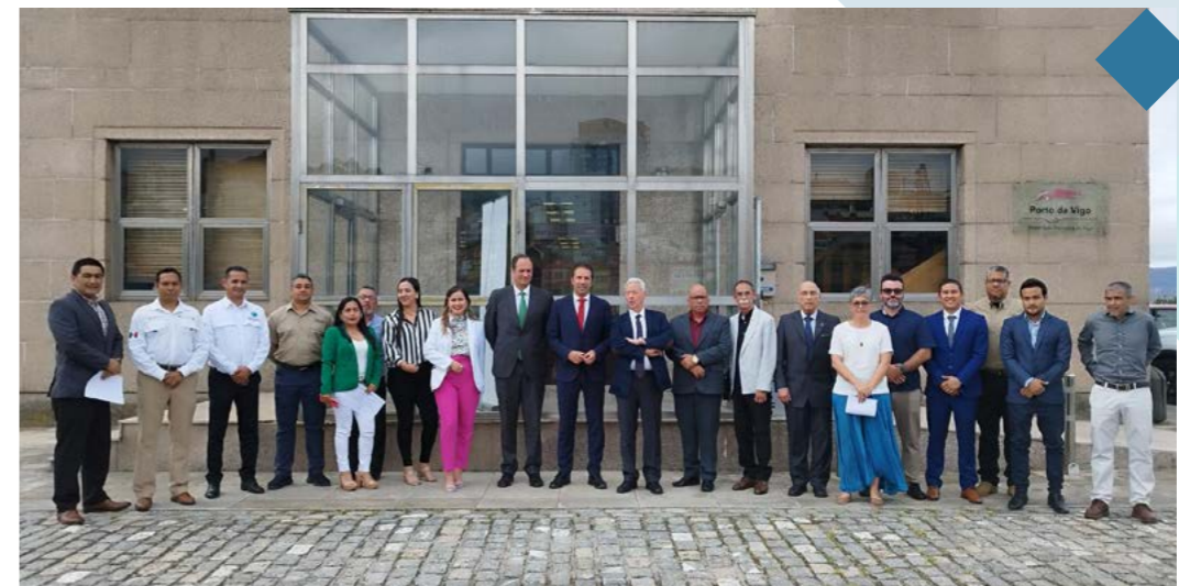
Entrega de diplomas a los participantes en el 3er curso de formación para inspectores de pesca liderado por FAO.