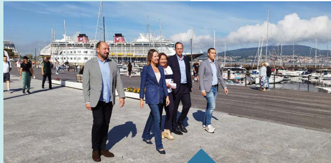
El Puerto de Vigo recibe, por primera vez en su historia, una quintuple escala de cruceros simultánea.

The Port of Vigo hosts, for the first time in its history, a five-fold simultaneous cruise call.