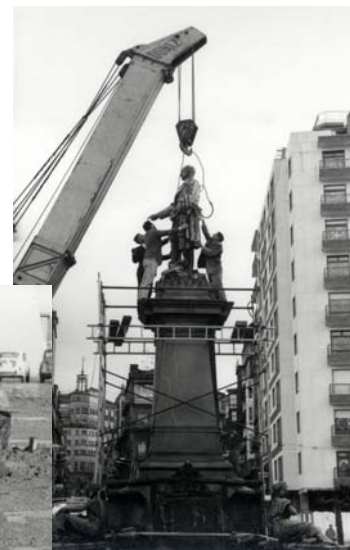
Primer traslado del monumento