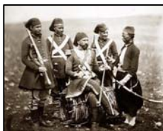
Guerra de Crimea, general turco.

Francia, presente ya en Argel, instaura el protectorado de Túnez, mientras que el Imperio Otomano, arruinado por la Guerra de Crimea (1853-1856) crea la Administración de la Deuda Pública Otomana para hacer frente a los gastos de la financiación internacional. Su poder de antaño se torna en