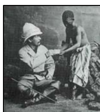
Henry Morton Stanley

El mundo empieza a quedarse pequeño y los grandes exploradores se aventuran en tierras ignotas. Nordenskjöld abre la ruta de navegación que rodea el Círculo Polar Ártico a lo largo de la costa rusa; Stanley funda Leopoldville, actual Kinsasa, capital de la República Democrática del Congo, mientras que los colonos boer consiguen el autogobierno para Transvaal.