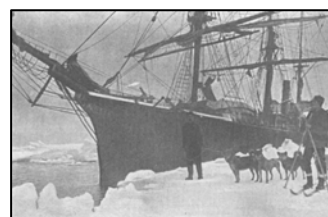
Adolf Erik Nordenskjöld

El mundo empieza a quedarse pequeño y los grandes exploradores se aventuran en tierras ignotas. Nordenskjöld abre la ruta de navegación que rodea el Círculo Polar Ártico a lo largo de la costa rusa; Stanley funda Leopoldville, actual Kinsasa, capital de la República Democrática del Congo, mientras que los colonos boer consiguen el autogobierno para Transvaal.