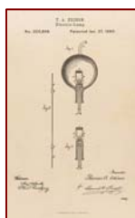
Patente de la bombilla de Edison

Mientras Menéndez Pelayo ingresa en la Real Academia de la Lengua y Rosalía de Castro publica “ El primer loco ”, novela corta que nos introduce en un mundo onírico, el mundo llora las pérdidas de Dostoyevski y de Musorgski, cuyas obras, literaria y musical respectivamente, representan la esencia del alma rusa. Y otro compatriota, el propio zar Alejandro II, aquel cuyo reinado se había iniciado con grandes reformas sociales en sintonía con los movimientos europeos en contra del absolutismo, muere asesinado ante la tendencia al despotismo autocrático hacia el que se ha ido conduciendo su gobierno.