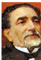
Práxedes Mateo SAGASTA

EL MUNDO EN 1881 , un mundo convulso y apasionante en el que el absolutismo regio está llamado a desaparecer. En España, Alfonso XII propicia la alternancia entre Cánovas y Sagasta en el Gobierno, mientras que el Imperio británico, bajo el reinado de la reina Victoria, pierde al que fuera nombrado “ el mejor orador de la Cámara de los Comunes ”, Benjamin Disraeli, uno de los pilares de la expansión territorial inglesa.