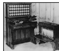
Tabuladora de Hollerith

Son tiempos de cambio, en los que la curiosidad del hombre sacará a la luz grandes descubrimientos. Pasteur prueba con éxito su vacuna anticarbuncosa, Edison demuestra al mundo en la Exposición Universal de la Electricidad de París cómo se puede iluminar una ciudad con sus bombillas incandescentes, y Hollerith comercializa su tabuladora, diseñada para realizar el censo de Estados Unidos de 1880 mediante una máquina que utiliza unas cartulinas que se perforan en función de las contestaciones si/no del formulario censal, creando un sistema de código binario en la que se considera la primera computadora de la historia, de la cual nacerá la empresa International Business Machines, IBM.