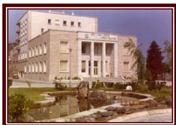
IMAGEN DE LA CUBIERTA:

Edificio de oficinas centrales de la Junta de Obras y Servicios del Puerto y Ría de Vigo en la Praza da Estrela