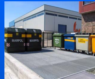
Punto Verde de recogida de residuos

Con una capacidad de 20 Toneladas de productos para su reciclado.