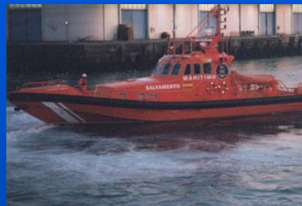
-Embarcación "Salvamar Mirage"