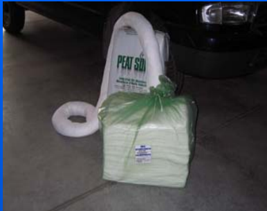
Material absorbente Capacidad inmediata de absorción 6.000 l

300 mantas absorbentes. 550 metros Barreras absorbentes Sacos de "Peat Sorb". 3 Sacos de Plumón absorbente. 2 Kit's anticontaminación