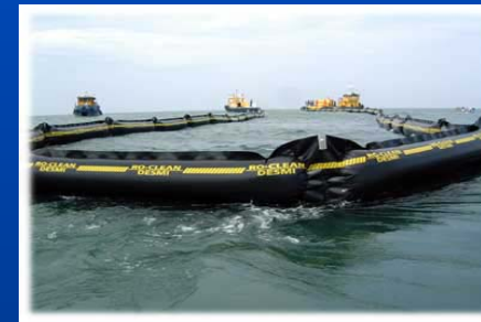
Barrera de Contención de Hidrocarburos

Con una capacidad de aspiración de 7 toneladas/hora y un peso de 18,5 Kg, lo que lo convierte en un equipo muy manejable y operativo para el uso diario