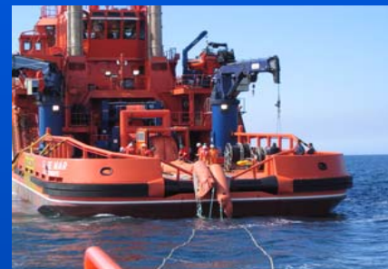
Buque anticontaminación "Luz de Mar", para grandes contingencias (Nivel 3)