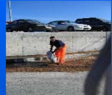
Equipos de protección individual para vertidos

Con una capacidad de 20 Toneladas de productos para su reciclado.