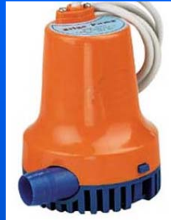
Sistemas de trasiego y achique

300 mantas absorbentes. 550 metros Barreras absorbentes Sacos de "Peat Sorb". 3 Sacos de Plumón absorbente. 2 Kit's anticontaminación